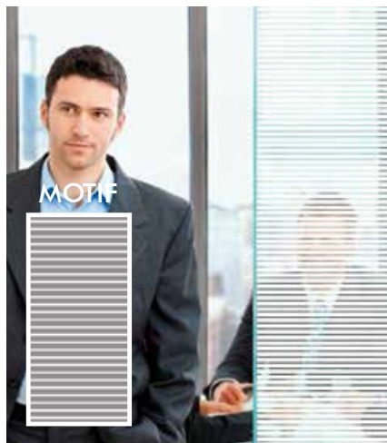
FILM DÉCORATIF À BANDES BLANCHES INT212F