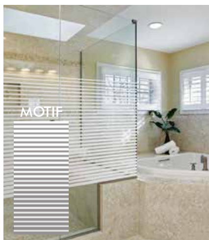
FILM DÉCORATIF À BANDES BLANCHES DÉGRESSIVES INT234