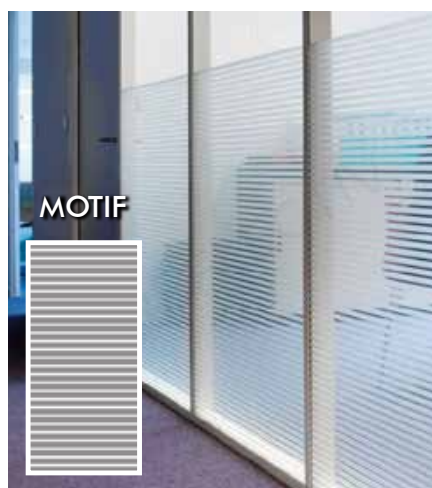
FILM DÉCORATIF À BANDES BLANCHES DÉPOLIES INT213