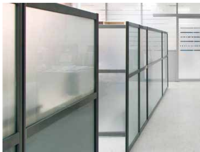
PLEIN SABLE INT256F

Support : PET 23 microns Adhésif : acrylique 13 gr/m 2 Protecteur : PET siliconé 23 microns Couleur : Blanc dépoli Application : interne T° d'application : min. + 5°C Classement au feu : B-s1,d0 Normes : Euroclasses Largeur : 1,52 m