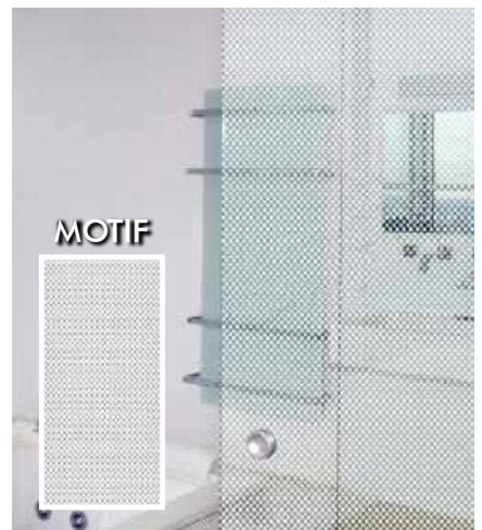
FILM DÉCORATIF POINTS BLANCS DE 3MM INT343