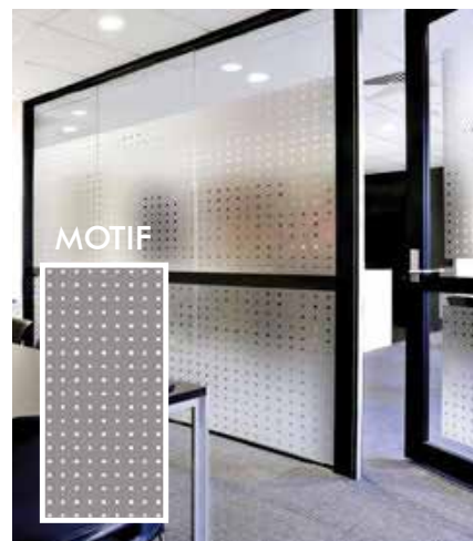
FILM DÉCORATIF DÉPOLI CARRÉS INT470