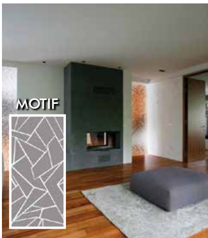
FILM DÉCORATIF E ET VERRE BRISE DÉPOLI INT520