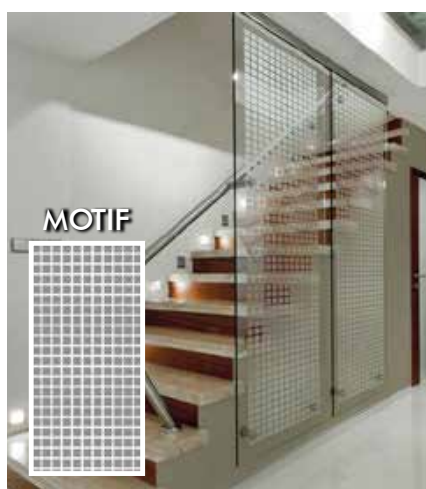
FILM DÉCORATIF DÉPOLI CARRÉS INT450