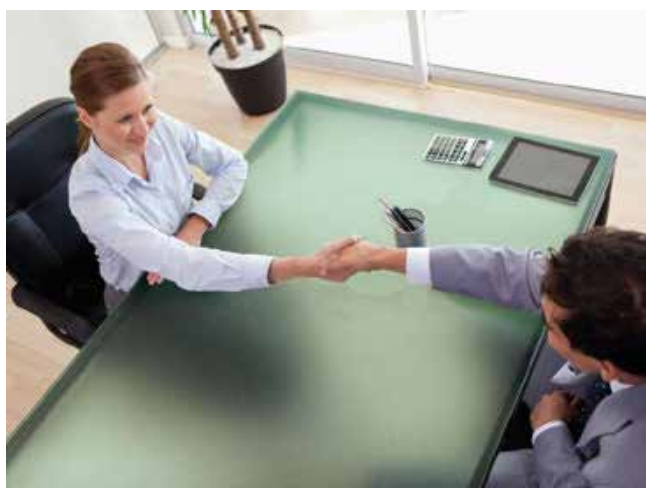
FILM DÉCORATIF DÉPOLI PLEIN PAILLETTE VERT