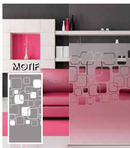
FILM DÉCORATIF DÉPOLI CARRÉS AVEC ANGLES ARRONDIS INT468