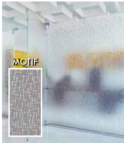
FILM DÉCORATIF DÉPOLI TRAITS CROISES INT490