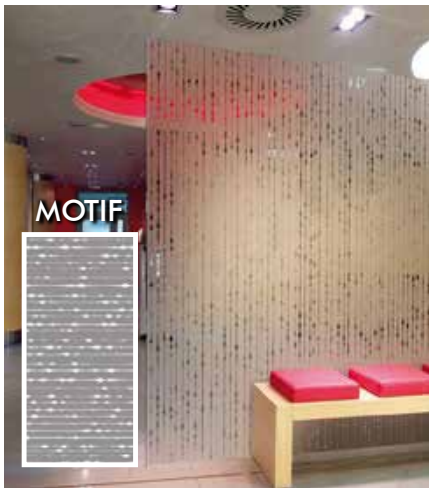
FILM DÉCORATIF DÉPOLI GOUTTES DE MIEL INT290