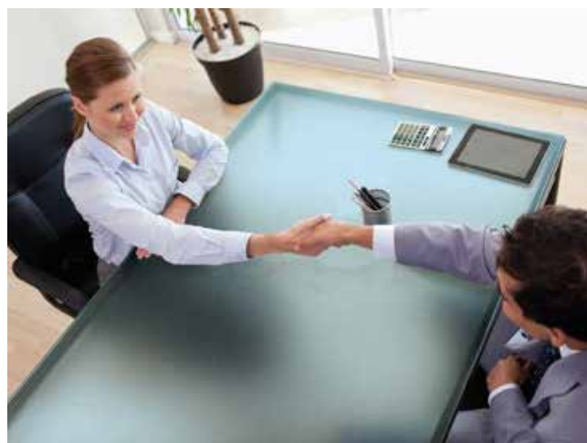
FILM DÉCORATIF DÉPOLI PLEIN PAILLETTE BLEU