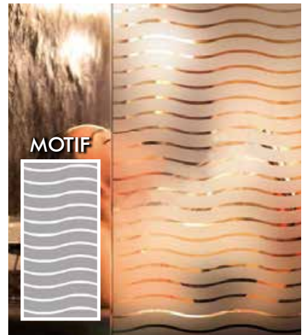
FILM DÉCORATIF VAGUES DÉPOLIES INT288